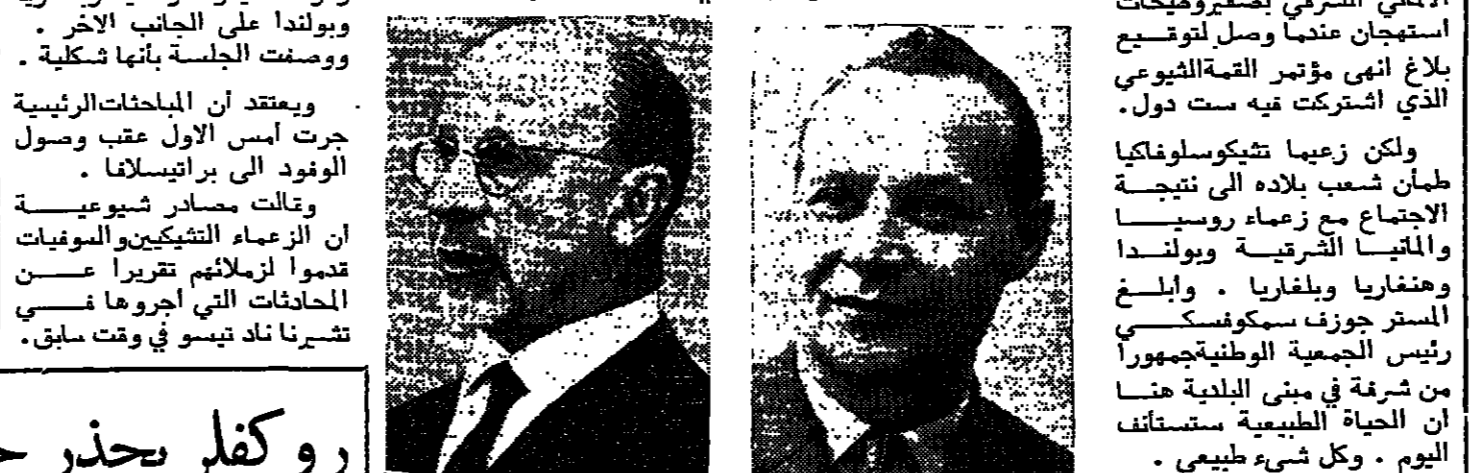
الاجتماع مع زعماء روسيا والمثابا الشرقية وبولندا وهنغاريا وبلغاريا. والمستر جوزيف سكوفاكسكي رئيس الجمعية الوطنية لجمهورية من شرفة في مبنى البلدية هنا ان الحياة الطبيعية مستأنفة اليوم. وكل شيء طبيعي.

وقالت وكالة انباء سيبتيكا وشقتها ابراة بزهور حمراء. ان المحادثات عقدت في جو ودي وصريح. وقد اقر بلاغ مشترك بالاجماع لدى انتهاء المحادثات. واطلق الجمهور صفرا وهتافات معادية. وفي غضون ذلك اعلنت وكالة انباء سيبتيكا التشيكية الرسمية واستقبل تشيكوسلوفاكيون الهير والتر اولبريخت الزعيم الاتمالي الشرقي بصغروميجات استهجانا عنيدا وصل لتوقيع بلاغ انهى مؤتمر القمة الشيوعي الذي اشتركت فيه ست دول. ولكن زعيما تشيكوسلوفاكي طمان شعب بلاده الى نتيجة الاجتماع مع زعماء روسيا والمثابا الشرقية وبولندا وهنغاريا وبلغاريا. والمستر جوزيف سكوفاكسكي رئيس الجمعية الوطنية لجمهورية من شرفة في مبنى البلدية هنا ان الحياة الطبيعية مستأنفة اليوم. وكل شيء طبيعي.